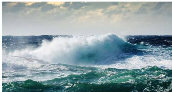
Erkrankungsrisiken durch arbeitsbedingte psychische Belastung. transfer 4

Zeitschrift für Arbeits- u. Organisationspsychologie (2015) 59 (N. F. 33) 3, 113–129 © Hogrefe Verlag, Göttingen 2015